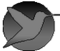
Colibri Advies BV